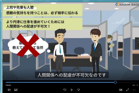
eラーニング学習画面 イメージ